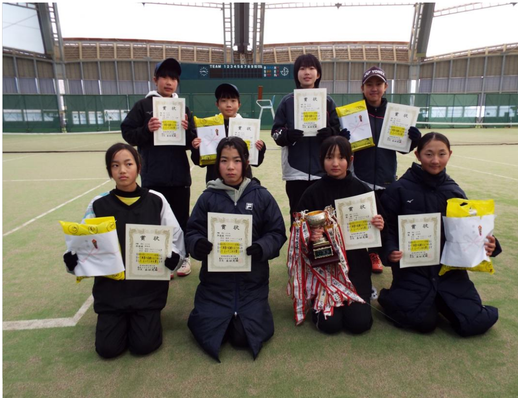
女子 第1位から第3位