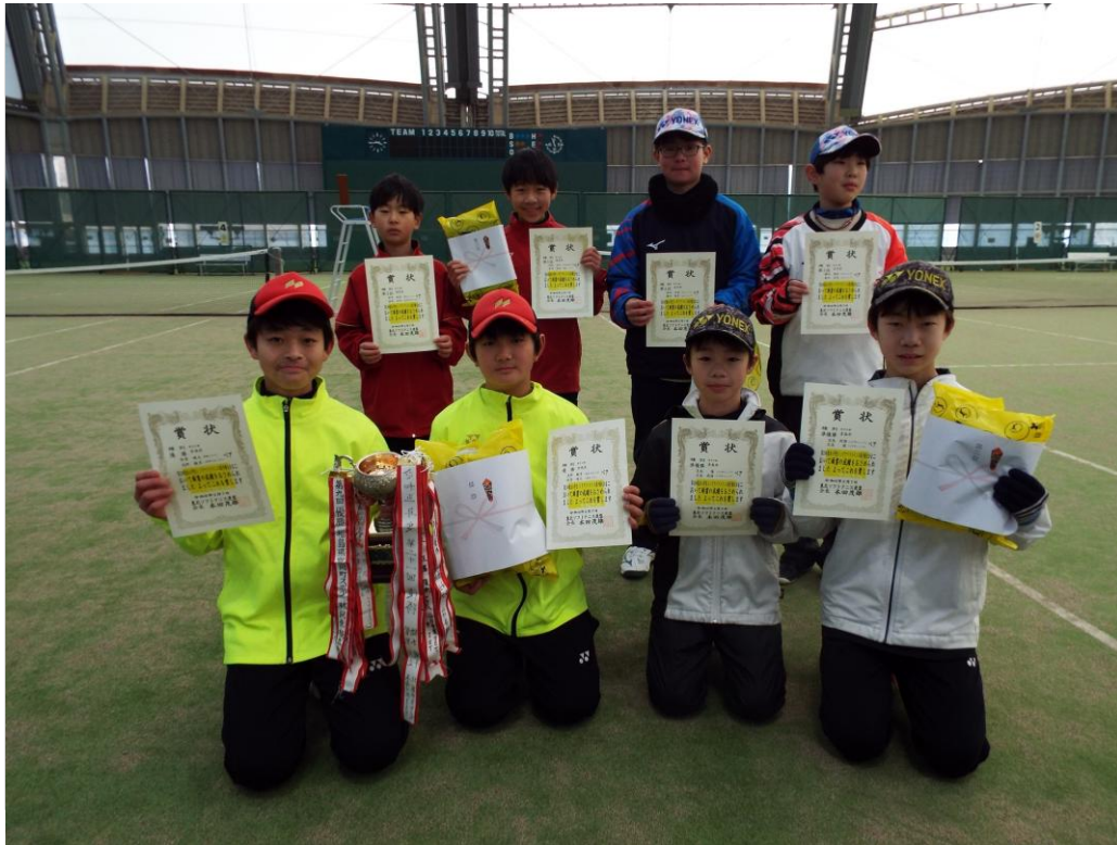
男子 第1位から第3位